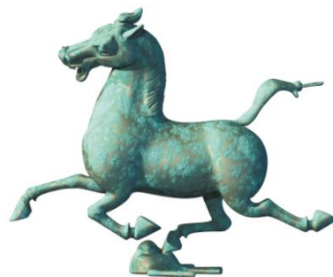
答案：“马踏飞燕”（或“马超龙雀”）

55. 1969 年出土于中国甘肃省武威县的青铜器_____，是中国青铜艺术的奇葩，现在已成为中国旅游的标志。